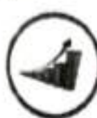
ความมั่งคั่ง