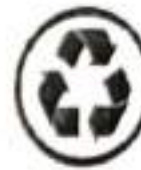
ความยั่งยืน