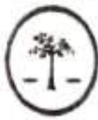
ความมั่นคง

วิสัยทัศน์ : "ประเทศไทยมีความมั่นคง มั่งคั่ง ยั่งยืน เป็นประเทศพัฒนาแล้ว ด้วยการพัฒนาตามปรัชญาของเศรษฐกิจพอเพียง"